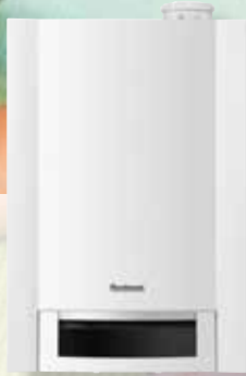
Logamax plus GB172 Logamax plus GB172T50